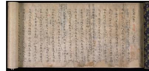
史記 孝文本紀第十 (国宝)