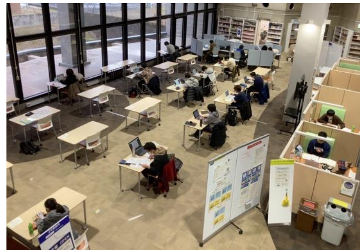
フィジカルディスタンス