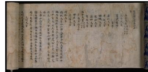
類聚國史 卷第二十五 (国宝)