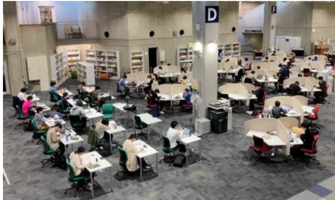
本館 1号館1階 メインフロア