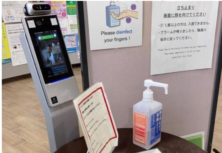
サーモカメラ・消毒液