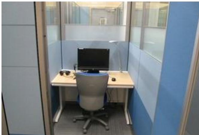
工学分館 Abelujo(アベルーヨ) ランゲージ・スタジオ