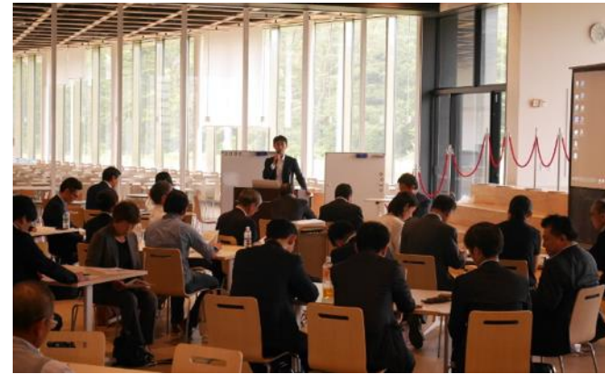
農学分館 （青葉山コモンズ内） ラーニングコモンズ