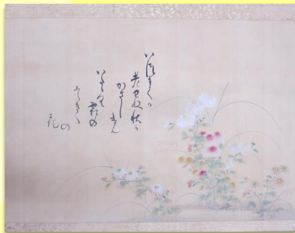
修復史料「秋田就季筆和歌（いつまてか云ー）」