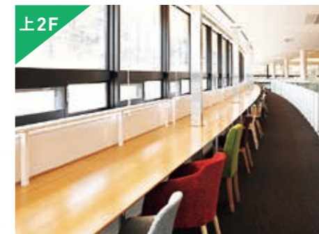
上2F 閲覧室ロフト 約60席

ユニバーシティパークが目の前に広がる採光豊かなカウンターテーブルには、多彩なフォルムの椅子を並べました。好みの椅子で、目の前の自然を感じながら学習することができます。