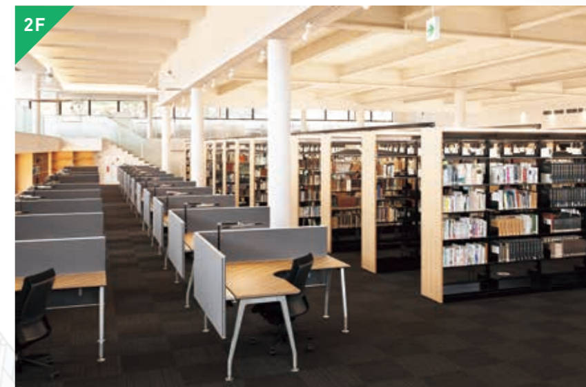
2F 静かなパーソナル学習空間 図書館閲覧室 約100席 【約21万冊収蔵可能】

ユニバーシティパークが目の前に広がる採光豊かなカウンターテーブルには、多彩なフォルムの椅子を並べました。好みの椅子で、目の前の自然を感じながら学習することができます。