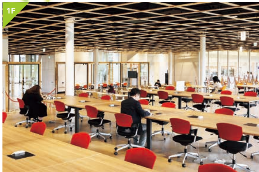
1F 自主的な学びと交流のためのラーニングスペース ラーニング commons 約160席

青葉山 commons は、農学部講義室と図書館（農学分館）、ラーニング commons からなる複合施設で、食堂と売店も備えた新キャンパスの共有地（commons）です。世界的なランドスケープデザイナーが設計した新キャンパスの中央、ユニバーシティパークとキャンパスモールに位置する2階建ての建物です。季節を感じる自然景観の中で、授業や自主的な学習・研究、食事や休憩にと、人々が学び、憩い、交流する場として、2017年4月に誕生しました。