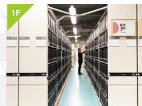
1F 各キャンパス図書館のデポジット 共用書庫

ユニバーシティパーク寄りの開放的な吹き抜けフロアは、学習や研究の合間に休息や交流ができるラウンジです。新聞やビジュアル図鑑、DVDなどもあり、気分転換や思索にも適した知的空間となっています。