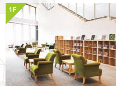
1F くつろぎの知的空間 図書館ラウンジ

書架上部のライトが印象的な閲覧室フロアでは、静かな空間で学習・研究を行うことができます。長時間集中するのにふさわしい、ゆったりとした機能性に優れたパーソナルワークデスクは、図書館における新たな学びの場としての魅力をもっています。