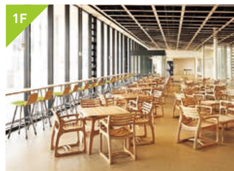
1F 人が行き交うコミュニケーションスペース エントランス

キャンパスモールに面したエントランスには、宮城県産スギを使用した温かみのある椅子とテーブルがあり（農学部同窓会寄贈）、待ち合わせや休憩・イベントにも利用できます。