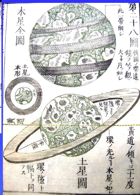
コッペルテンモン スカイ 刻白爾天文圖解 司馬峻江漢 文化5年(1808)

展示期間：2009年6月8日～8月末 平日及び7月までの土 8：00～22：00 日・祝日及び8月の土 10：00～22：00