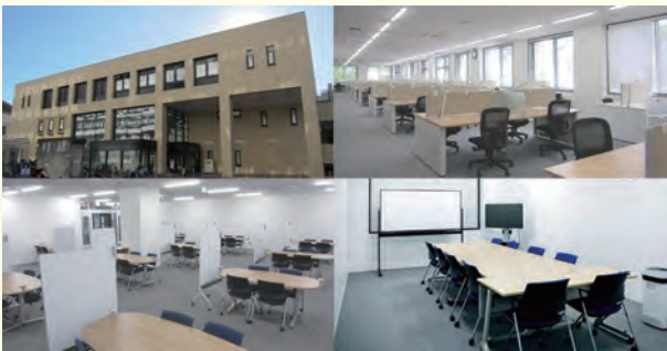
▶(左) 建物外観、ラーニングcommons (右) 閲覧室、グループ学習室

URL https://www.library.med.tohoku.ac.jp/