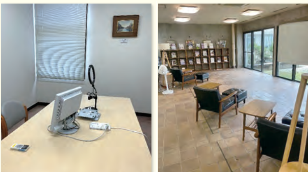
▶(左) 落ち着いた雰囲気の個室 (右) 飲食可能なエントランス

URL https://www.library.tohoku.ac.jp/eng/