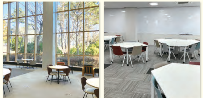
▶(左) エントランスホール (右) ラーニングcommons

URL https://www.library.tohoku.ac.jp/kita/