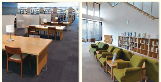
▶(左) 広々とした閲覧席 (右) 吹き抜けのラウンジ席

URL https://www.library.tohoku.ac.jp/agr/