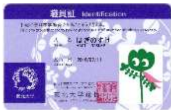
新職員証で利用可