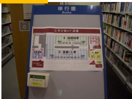
2F 図書 案内板