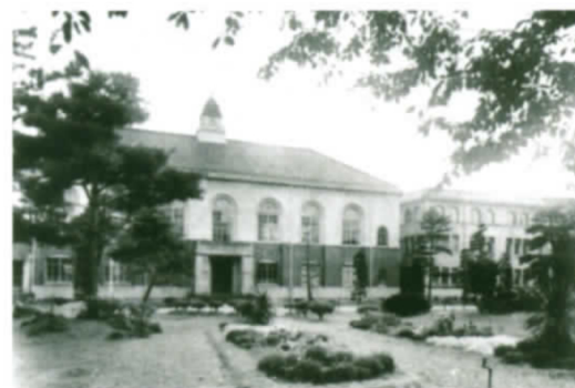
当時の附属図書館(現在の史料館)

第一期 日時：平成23年10月14日(金)～10月25日(火) 場所：せんだいメディアテーク 5階ギャラリー 第二期 日時：平成23年10月29日(土)～11月10日(木) 場所：東北大学附属図書館本館1階展示室